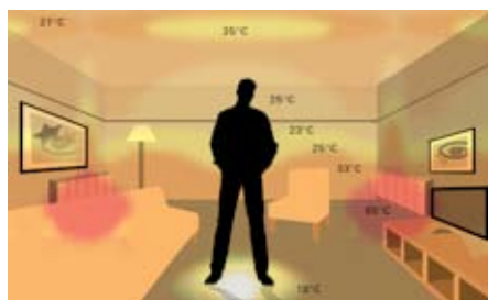
Rozloženie teplôt pri použití tradičného vykurovacieho systému s radiátormi. Veľké rozdiely teplôt v miestnosti (18 – 35°C).

Tradičné nástenné vykurovacie telesá ohrievajú vzduch vo svojom najbližšom okolí, ktorý následne stúpa ku stropu. Podlahové vykurovanie Raychem zaisťuje rovnomerné šírenie tepla v celej miestnosti, pričom najteplejšia zóna sa nachádza presne tam, kde je to potrebné.