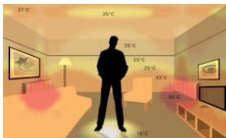
Rozloženie teplôt pri použití tradičného vykurovacieho systému s radiátormi. Veľké rozdiely teplôt v miestnosti (18 – 65°C).

Tradičné nástenné vykurovacie telesá ohrievajú vzduch vo svojom najbližšom okolí, ktorý následne stúpa ku stropu. Podlahové kúrenie Raychem zaisťuje rovnomerné šírenie tepla v celej miestnosti, pričom najteplejšia zóna sa nachádza presne tam, kde je to potrebné.